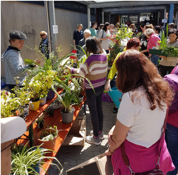
4. Pflanzentauschbörse der Landfrauen

Die Landfrauen danken allen Besuchern, die sich wieder aufgemacht haben, bei der 4.Pflanzentauschbörse in Hülben dabei zu sein.