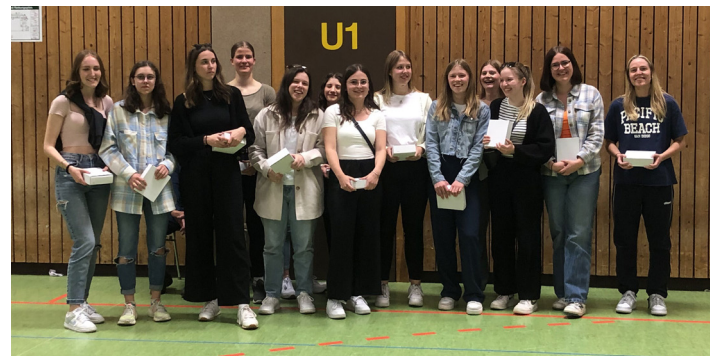
Ehrung zum Aufstieg der Frauen 2