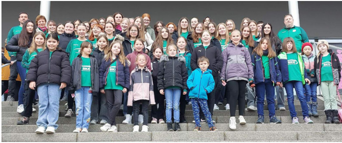
Die Gruppe vor der Öschhalle