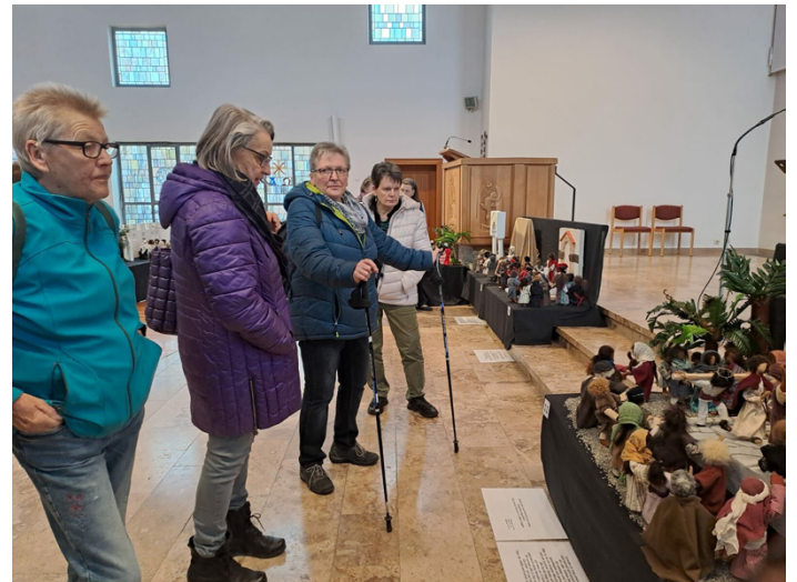
Landfrauen betrachten die einzelnen Szenen der "Passions- u. Ostergeschichte."

Anschließend ging es in den „Hülbener Landfrauen-TREFF“ zum gemütlichen Kaffee-Mittag.