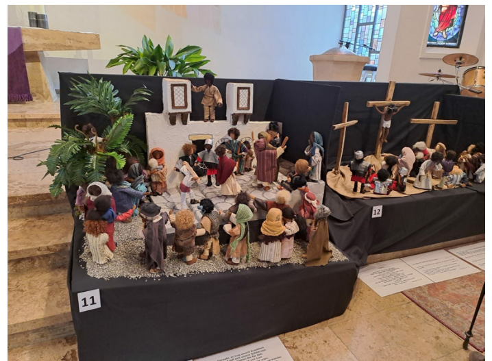
15 beeindruckende Stationen