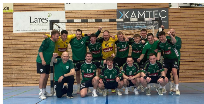
Die Erste nach dem Auswärtssieg