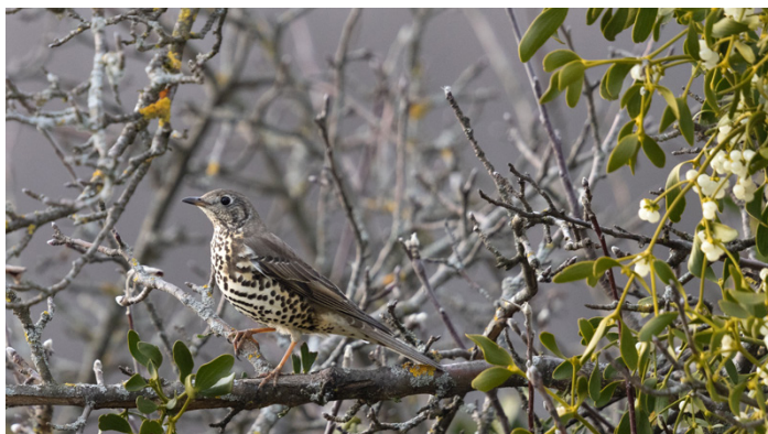
Misteldrossel mit Mistel

OGV sucht Mistelbäume auf der Gemarkung Grabenstetten