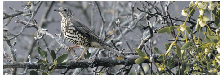
Misteldrossel mit Mistel