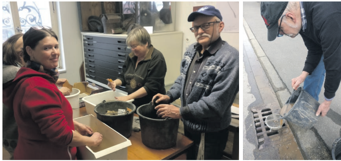
Scherben u.a. begutachten

Die archäologische Gruppe ist vielfältig tätig und auch in historischem Gelände unterwegs. Wer Interesse hat und aktiv an der archäologischen Arbeit mitwirken will, ist herzlich eingeladen. Kontakt über info@fakt-ev.com