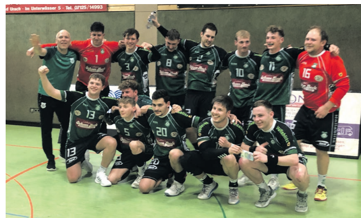
Unsere Erste nach dem Derbysieg

Brühlhalle, Reichenbach M-BK 20.00 Uhr TV Reichenbach 2 - TSV Grabenstetten 2