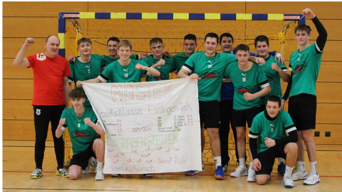
Unsere erfolgreiche A-Jugend