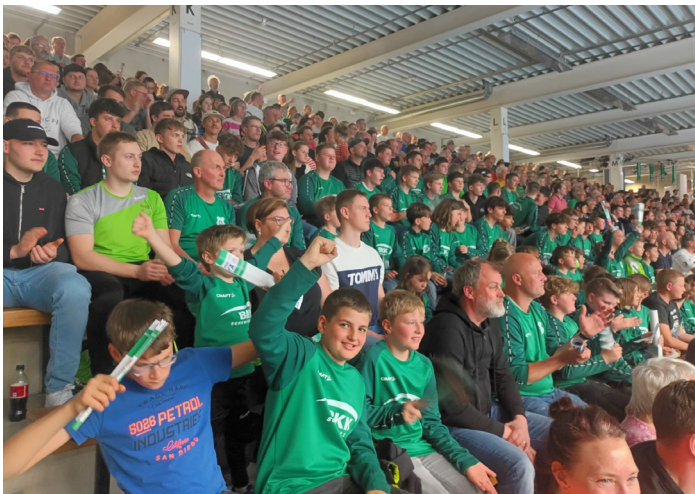
Die „grüne“ Grabenstetter Wand

Am vergangenen Freitag, den 03. Mai, waren unsere männlichen Jugendmannschaften zusammen mit ihren Trainern bei Frisch Auf! Göppingen. Bundesliga live zu erleben, für viele ein ganz besonderes Erlebnis! Auch für Autogrammjäger nahmen sich die Bundesligaspieler noch Zeit!