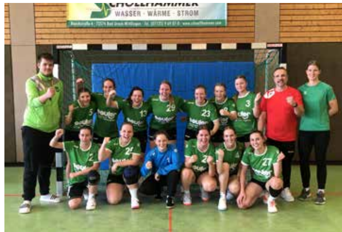
Unsere Frauen 2, Tabellenführerinnen

Egelsee-Sporthalle 1, Neuhausen/Filder M-KLB 13.00 Uhr TSV Neuhausen/F. 3 - TSV 3 M-BL 17.00 Uhr TSV Neuhausen/F. 2 - TSV