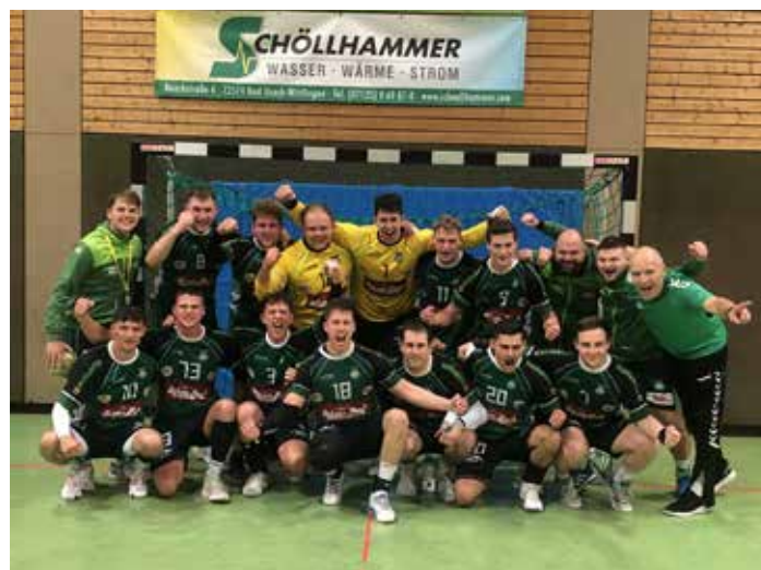
Unsere Männer 1 nach dem Derbysieg