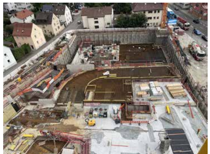
Blick auf die Baustelle von einem Kran aus