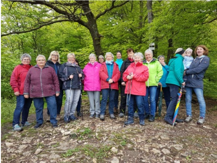
Herrliche Aussicht vom "Buckleter Kapf"

So ging ein schöner Mittag bei den Landfrauen zu Ende.