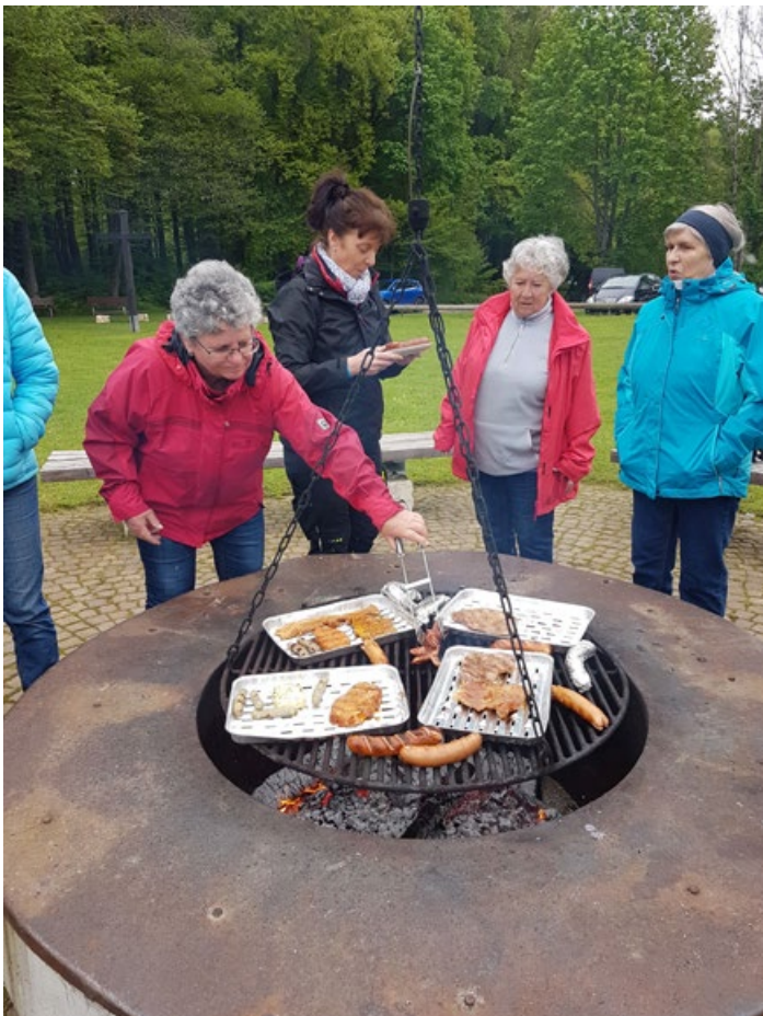
Die Glut brannte schon in der "Grillstelle" auf "Etzenberg"