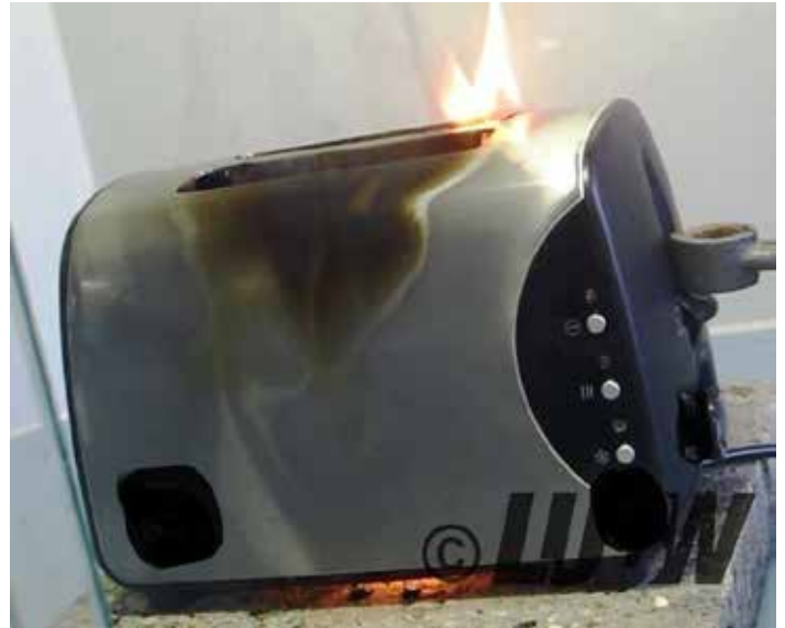
Brennender Toaster

Für weitere Informationen zur Tätigkeit der Marktüberwachung Baden-Württemberg und um Berichte über abgeschlossene Überwachungsaktionen einzusehen, besuchen Sie gerne den Internetauftritt des Regierungspräsidiums Tübingen unter https://rp.baden-wuerttemberg.de/rpt/abt11/a-z/ .