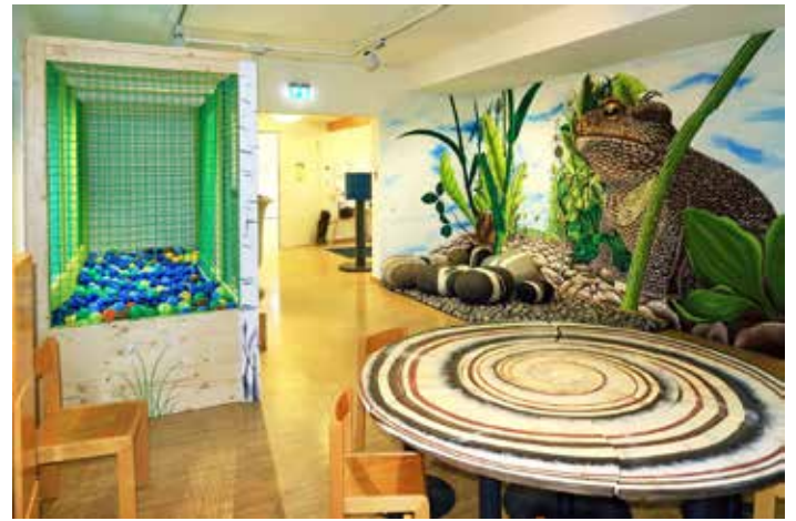
Ein Schneckentisch, ein Bällebad und phantasievolle Wandbilder – so sieht das neu gestaltete Albentdecker-Zimmer im Naturschutzzentrum Schopflocher Alb aus.

Die Neugestaltung des Albentdecker-Zimmers kostete insgesamt 29.000 Euro, 80 Prozent davon kommen aus Mitteln der Baden-Württemberg-Stiftung, die dem UNESCO zertifizierten Biosphärengebiet Schwäbische Alb zur Verfügung gestellt wurden. „Wir danken der Stiftung sowie der Geschäftsstelle des Biosphärengebiets Schwäbische Alb für die Förderung, nur durch das Zutun beider konnte das Spielzimmer verwirklicht werden“, sagte der Esslinger Landrat.