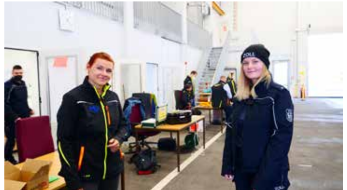
Mitarbeiterinnen und Mitarbeiter der Marktüberwachung und des Zolls