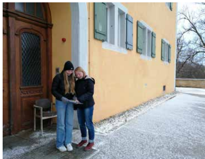
Foto: Jugendguides leiten Interessierte durch die Gedenkstätte und das Schloss Grafeneck.

Offene Fragen? Interessierte können diese bei den Online-Fragerunden am 23. März oder 13. April, jeweils ab 18:30 Uhr unkompliziert stellen. Informationen gibt es unter www.kultur-machen.de/Jugendguides oder direkt bei Antje Kochendörfer unter der Nummer 07121 480 1320.