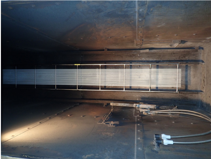
Bild 1: Messung der Wärmefreisetzung und Raucherzeugung von Kabeln nach EN 50399 – vor dem Versuch

Relevante europäisch harmonisierte Norm: EN 50575:2014+A1:2016 "Starkstromkabel und -leitungen, Steuer- und Kommunikationskabel - Kabel und Leitungen für allgemeine Anwendungen in Bauwerken in Bezug auf die Anforderungen an das Brandverhalten"