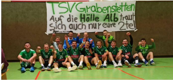
Die erfolgreiche Mannschaft gegen den TV Altbach 2

gJF-1 15.00 Uhr JANO Filder - TSV HSG OLE - TV Plochingen TSV Deizisau - SG He-Li