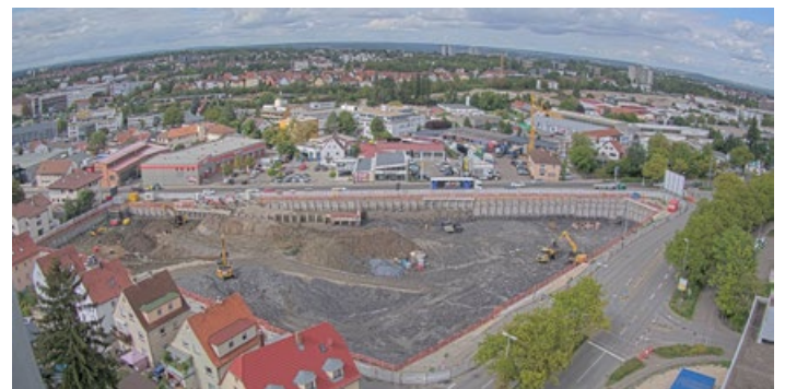
Luftbildaufnahme der Baustelle

Aktuell sind zwischen zehn und fünfzehn Personen ständig vor Ort, welche mit verschiedenen Maschinen arbeiten: drei schwere Kettenbagger sind im Einsatz, ein Muldenkipper, zwei Bohrgeräte zur Rückverankerung der Baugrubenumschließung und ein Radlader. Bis Ende des Jahres sollen die Aushubarbeiten abgeschlossen sein, um die Erdsonden für die Wärmegewinnung einzubringen und im Anschluss mit dem Rohbau zu beginnen.