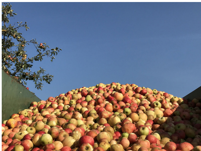
• Foto angenommener Äpfel

Die jeweiligen Annahmezeiten und den Beginn der Annahme in den einzelnen Keltereien sind der Aufstellung zur Obstannahme für ebbes Guad's zu entnehmen, die ebenfalls online zu finden ist.