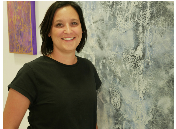
Foto: Simone Urbanietz-Preiss im Kultspace Münsingen.

Das aktuelle Programm im Kultspace Münsingen, Uracher Straße 5, ist unter www.kultur-machen.de/kultspace einzusehen.