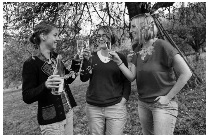
Titel: Most & Meet

Schwäbisches Streuobstparadies e.V., Bismarckstraße 21, 72574 Bad Urach, E-mail: kontakt@streuobstparadies.de