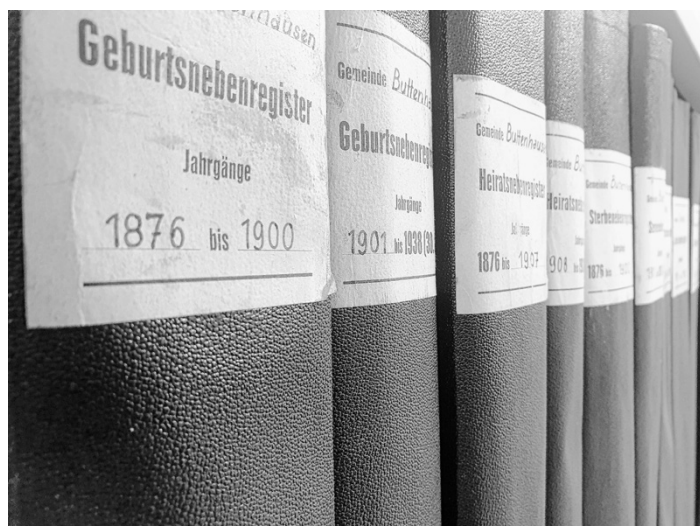
Personenstandsbücher im Kreisarchiv Reutlingen; Foto: Kreisarchiv Reutlingen.

Es ist auch eine klassische Einwahl per Telefon unter der Festnetznummer 0619 6781 9736 möglich. Dann muss nur noch über die Telefontastatur die Meeting-Kennnummer 2393 810 3137 eingegeben werden, um der Sprechstunde beitreten zu können.