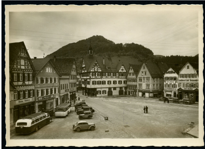
Foto: Ortsforschung ermöglicht spannende Einblicke in vergangene Zeiten: Marktplatz Bad Urach um das Jahr 1940, Kreisarchiv Reutlingen S 06 Nr. 258

Es ist auch eine klassische Einwahl per Telefon unter der Festnetznummer 0619 6781 9736 möglich. Dann muss nur noch über die Telefontastatur die Meeting-Kennnummer 2393 810 3137 eingegeben werden, um der Sprechstunde beitreten zu können.