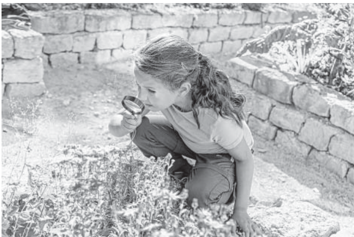
Der Natur auf der Spur.

Suche dir ein Insekt in deinem Garten, auf dem Balkon oder deiner näheren Umgebung. Beobachte es über einen Zeitraum und versuche, so viel wie möglich über es herauszufinden. Passe dabei gut auf, dass du dem Insekt keinen Schaden zufügst und fange es nicht ein. Vielleicht kannst du in einem Buch oder auch im Internet noch weitere spannende Informationen über das Tier aufspüren. Beschreibe nun, was du entdeckt oder erlebt hast. Was gibt es sonst noch über das Insekt zu erzählen? Schreibe alle Informationen auf, z. B. in einer Art Naturtagebuch. Deiner Kreativität kannst du freien Lauf lassen.