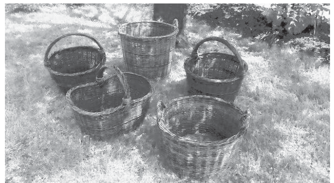
Ein selbstgemachter Korb hat viele Verwendungsmöglichkeiten.

Die Veranstaltung ist Teil des Jahresprogramms des Biosphärenzentrums Schwäbische Alb. Das komplette Programm und aktuelle Informationen sind online unter www.biosphaerengebiet-alb.de/ Veranstaltungen abrufbar.