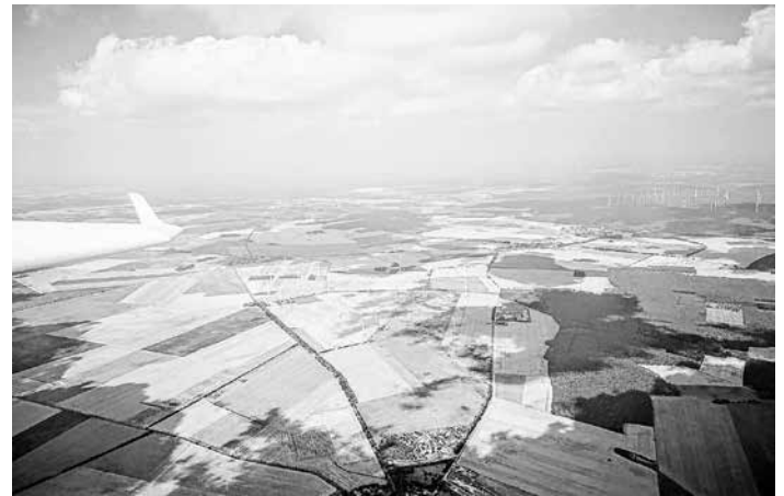
Blick auf das Fläming