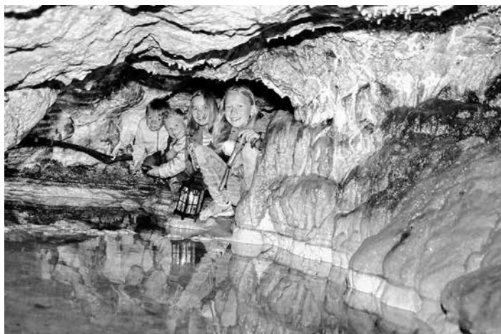
Sonderführung Nebelhöhle

Tourismusgemeinschaft Mythos Schwäbische Alb Bismarckstraße 21, 72574 Bad Urach Tel.: 0 71 25 / 150 600 info@mythos-alb.de www.mythos-alb.de