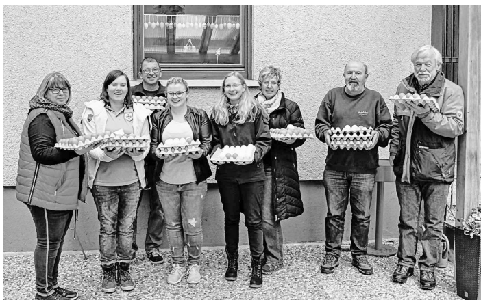
Die ersten neun Gewinner beim Ostereierschießen

Alle Ergebnisse sind auch auf unserer Homepage www.schuetzenverein-grabenstetten.de nachzulesen.