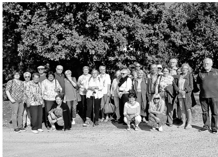
Für ein Gruppenbild blieb allemal Zeit

Nach der Besichtigungstour war für die 35-köpfige Gruppe freie Zeit, um die Stadt, die mehr Brücken als Venedig hat, zu erkunden. Die Altstadt mit ihren verwinkelten Gässchen, dem Perlachturm und ebenso reizenden Cafés lud zum Bummeln und Verweilen ein. Den Abschluss bildete ein Besuch des Bauernmarktes in Dasing, wo es nochmals die Möglichkeit gab, sich zu stärken, bevor es auf die Heimfahrt ging. Auch Mitbringsel und regionale Produkte konnten dort gekauft werden.