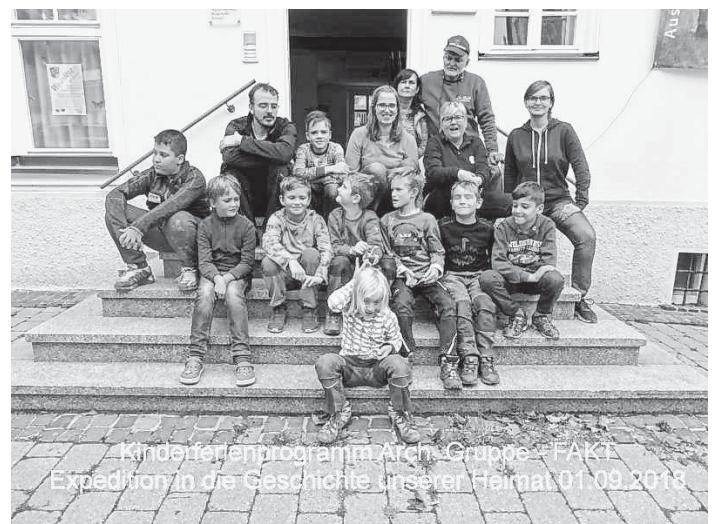
Kinderferienprogramm Arch. Gruppe – FAKT Expedition in die Geschichte unserer Heimat 01.09.2018

Expedition in die Geschichte unserer Heimat 01.09.2018 Wieder einmal war es soweit – Sommerferien und KiFePro der arch. Gruppe. Eine muntere Schar von 9 Jungen und Betreuern machten sich am Morgen des 1. September auf die Suche nach „Schätzen“. Wie immer war die Begehungsfläche nicht präpariert – entweder man hat Glück und findet viel, oder man hat weniger Glück und findet fast gar nichts. Nachdem die Stofftaschen mit Scherben und anderen Fundstücken gefüllt waren, ging es zurück nach Erkenbrechtsweiler. Dort wurde erst eine ausführliche Stärkung zu