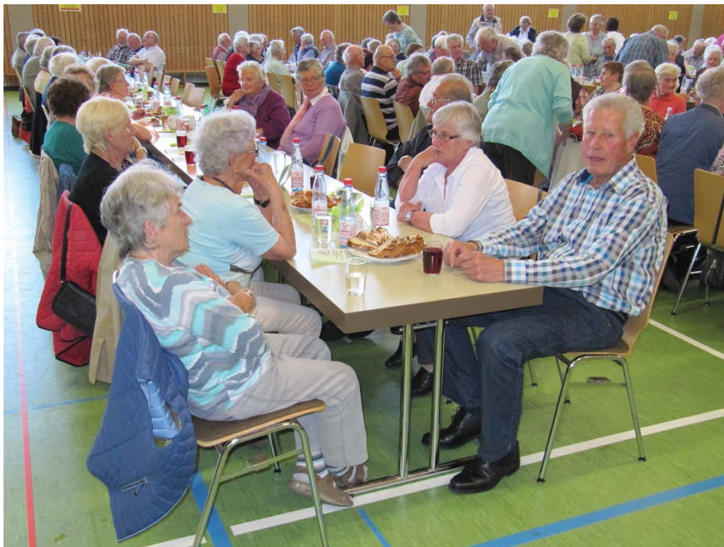
Foto: gemeinsamer Seniorennachmittag 2015 in Grabenstetten