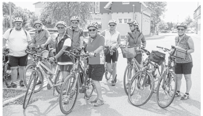
Start zur Radtour über die Stubersheimer Alb