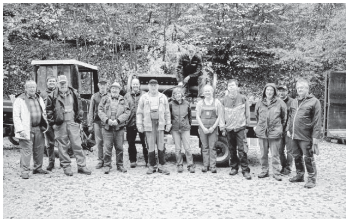
Das Helferteam von der Alteisensammlung