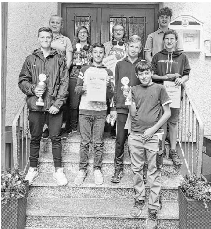
Die erfolgreichen Teilnehmer des Ferienprogramms