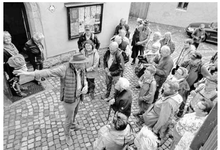
Führung in Untereggenbach