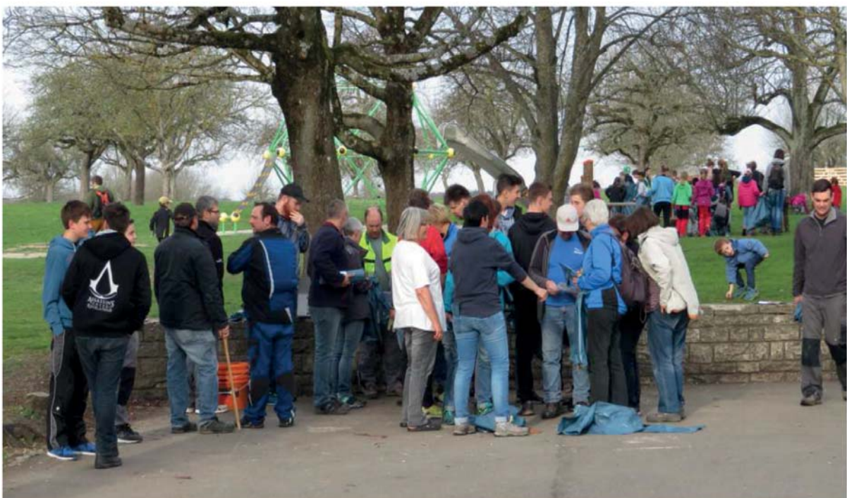
Bild von der letzten Markungsputzete in 2017

Wir treffen uns um 9.00 Uhr am Feuerwehrgerätehaus .